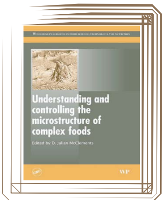
Understanding and controlling the microstructure of complex foods. TX 531 u6.

Covers the marine life - the fishes, mollusca, invertebrates, reptiles - all species in the Red Sea region, which includes the Arabian Gulf, Arabian Sea, Gulf of Oman, Gulf of Suez and Gulf of Aquaba. Over ten percent of the fish life here is endemic making the region one of the most fascinating, and of course unique, in the world. And once again, this IKAN book contains over 1000 excellent colour photographs, most, but not all, by the author. And of course there are the picture stories - thirteen of them, including a superb essay on marine animals as souvenirs. And why is it called the Red Sea? - The book has the answer.